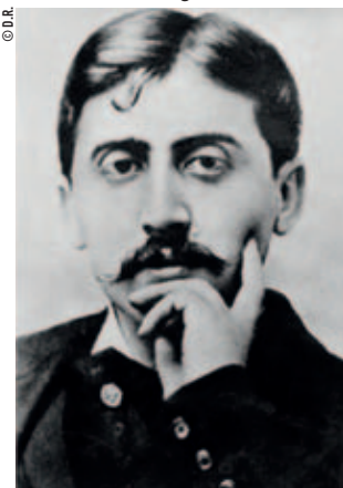
Proust à Cabourg.