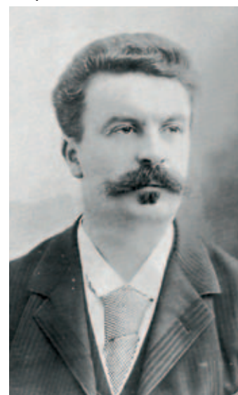
Maupassant à Avranches.

Avec le site et l'appli mobile Géoculture, la France vue par les écrivains, chacun peut consulter et contribuer à une cartographie de l'écriture contemporaine.