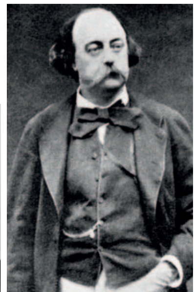
Flaubert à Trouville-sur-Mer.